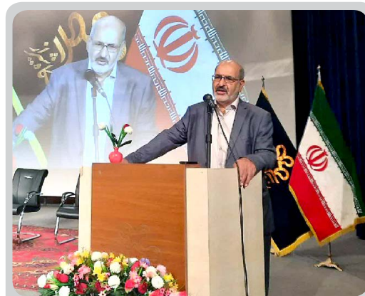
با حضور دکتر پورعباس برگزار شد